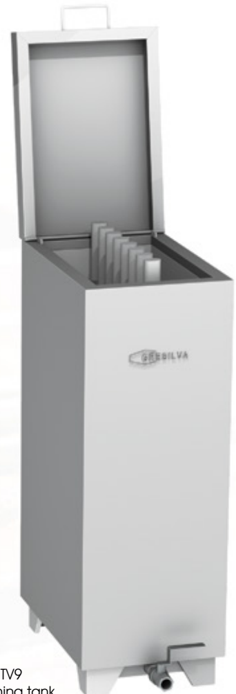
Mod TV9 Grid cleaning tank

The GRESILVA® ROTATING GRILL R3 , although it has no horizontal grill, it allows three rotating grids for spatchcock chicken at the same time in a small space.