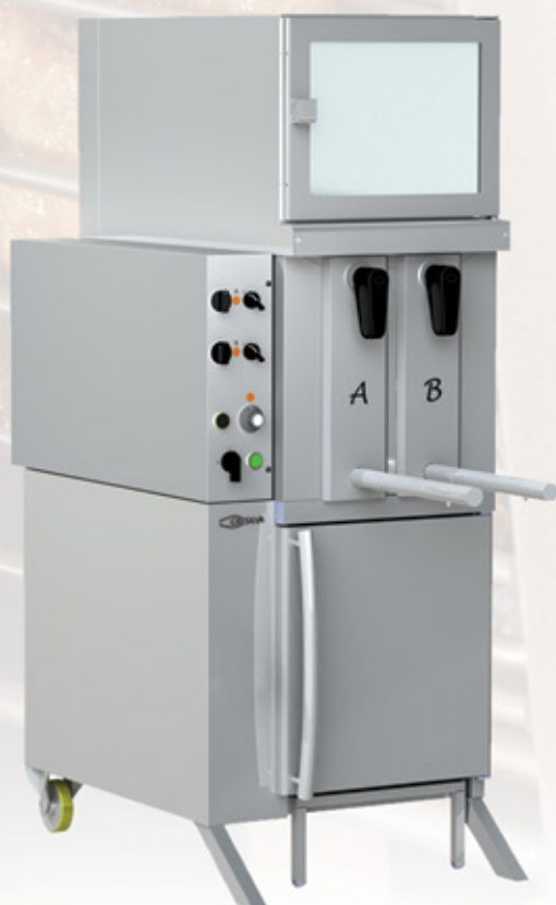
Mod GV 2