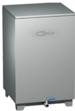
Mod TV 4