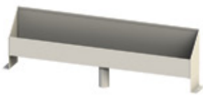
gutter | caleira gouttière | calera