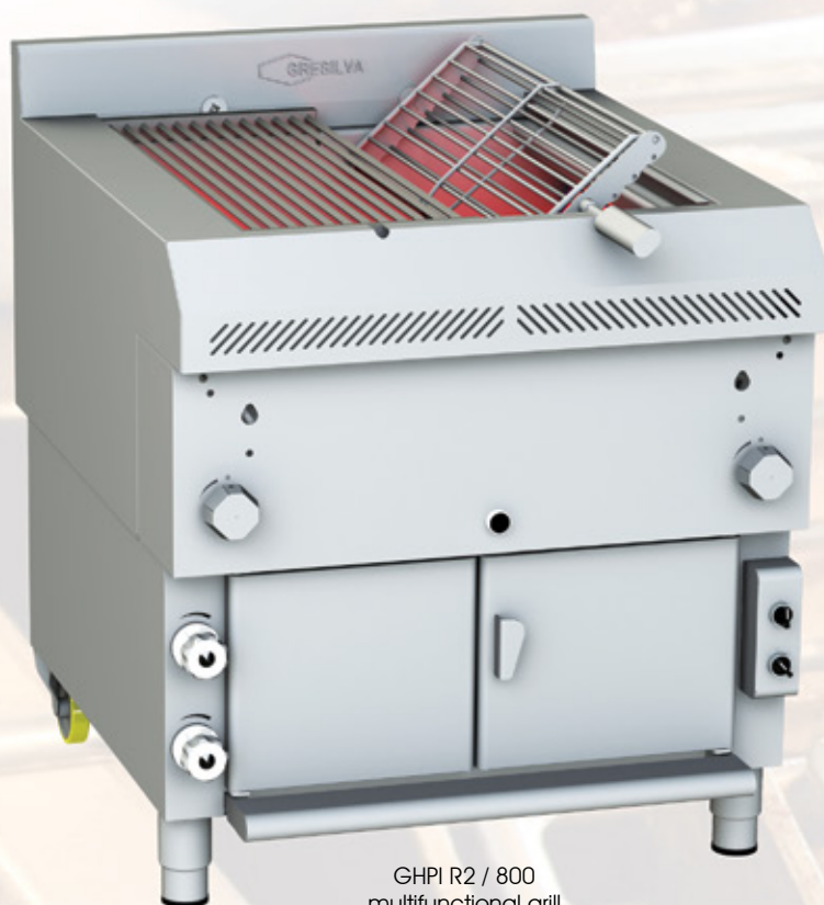
GHPI R2 / 800 multifunctional grill