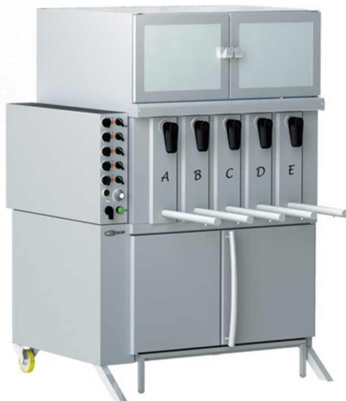
Mod GV 5