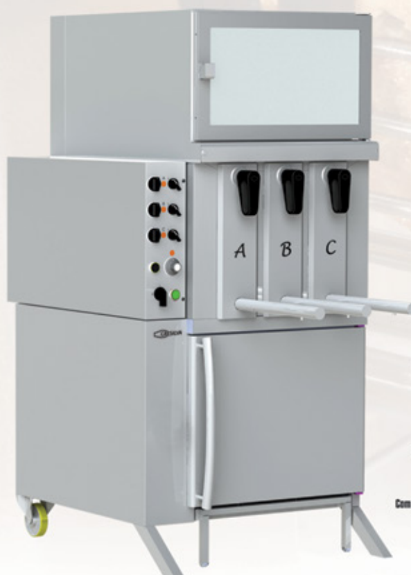
Mod GV 3