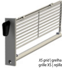
XS grid | grelha XS grille XS | rejilla XS