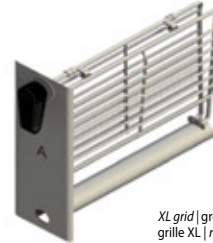
XL grid | grelha XL grille XL | rejilla XL