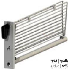
grid | grelha grille | rejilla