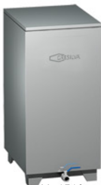
Mod TV 3