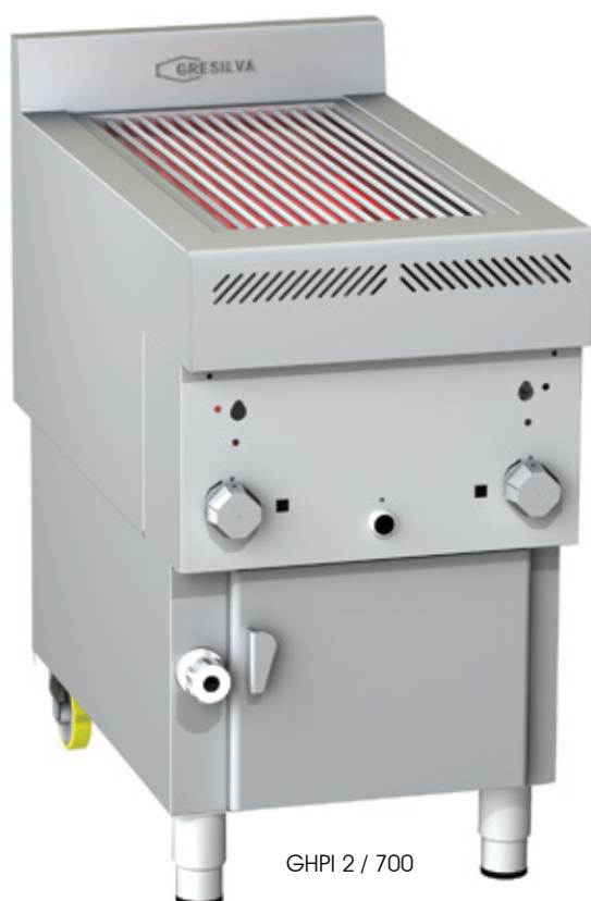
GHPI 2 / 700

Grelhados na brasa sem chama e sem carvão!