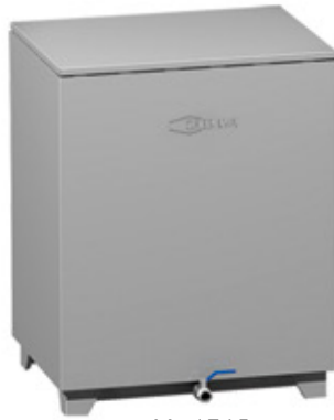
Mod TV 5