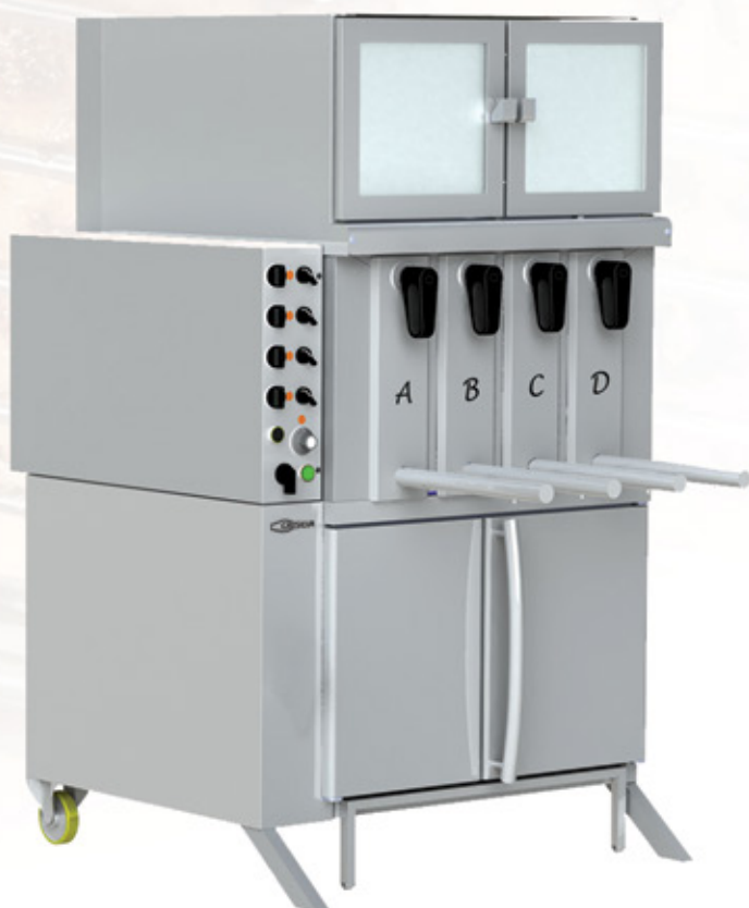
Mod GV 4

Winner of a gold medal at the International Exhibition of Nuremberg IENA 81 - Germany PREMIADO com medalha de ouro na Exposição Internacional de Nuremberg IENA 81 - Alemanha A REÇU LE PRIX avec une médaille d'or dans l'Exposition Internationale de Nuremberg IENA 81 - Allemagne PREMIADO con medalla de oro en la Exposición Internacional de Nuremberg IENA 81 - Alemania