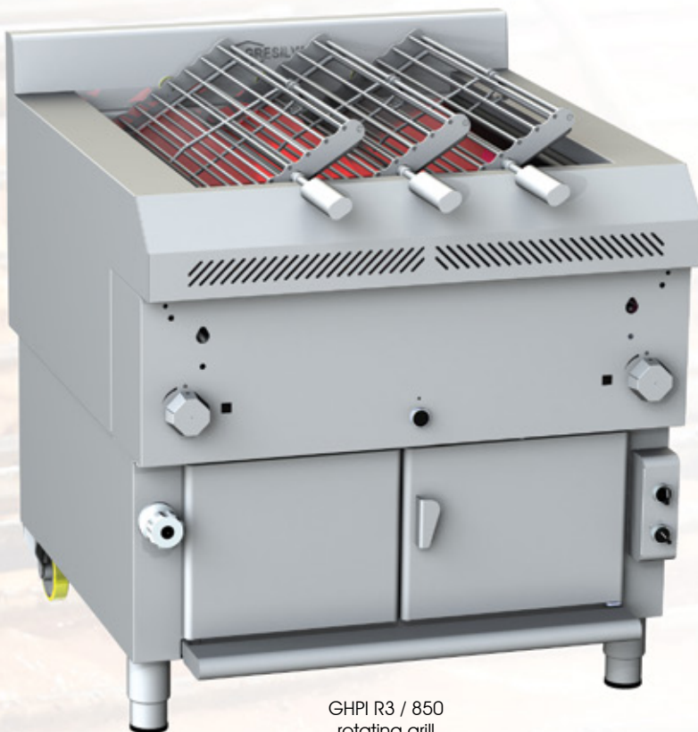
GHPI R3 / 850 rotating grill