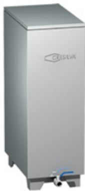
Mod TV 2