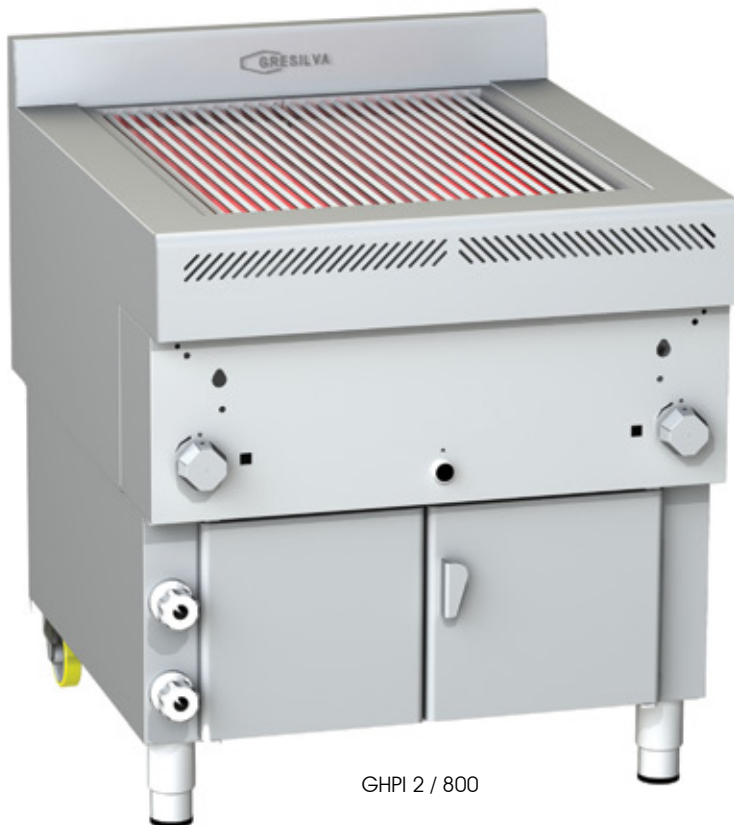
GHPI 2 / 800

Sienta el aroma de un asado 100% natural