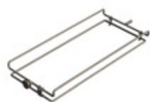
GRE.R1.K10 grille pour nervure