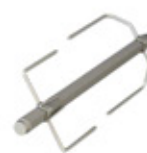
GRE.R1.T10 demi broche pour couchon