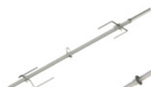
GRE.R4.P10 broche pour couchon