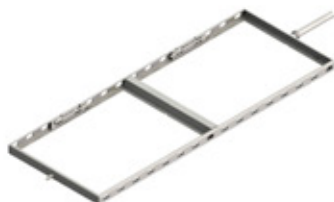
GRE.R1.H10 support de grille tourné