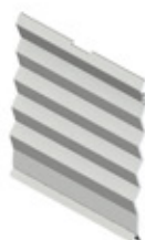
GRE.R1.C20 plaque diviseur