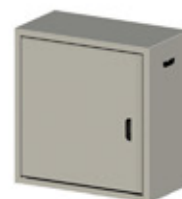
RE.R1.U10 appui à deux bouteilles de gaz