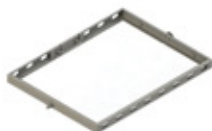
GRE.R1.H20 1/2 support de grille tourné