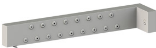
GRE.R1.V10 rotation du module