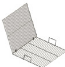
GRE.R1.J10 grelha dupla