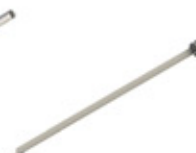
GRE.R1.M20 meio espeto rodizio