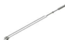
GRE.R1.V40 mini espeto duplo