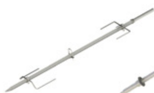
GRE.R4.P10 espeto porco