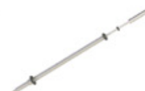
GRE.R1.V30 mini espeto rodizio