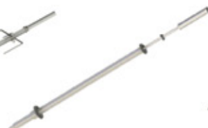
GRE.R4.M10 espeto rodizio